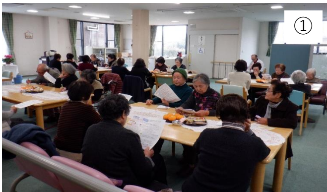
演者の話を真剣に聞く地域の皆様

昨年、介護老人保健施設めぐみは、地域貢献活動として3回「めぐみカフェ」を開催しました。回を重ねる毎にご参加頂く地域の方が増えていくので、大変ありがたいと思っております。めぐみの施設の中に入って頂き、職員と話をして頂くことでめぐみを知って頂き、地域の方と顔の見える関係づくりを行いながら、地域の皆様へ少しでも貢献できることを毎回考えて、計画をしております。次回は4月頃を予定しております。