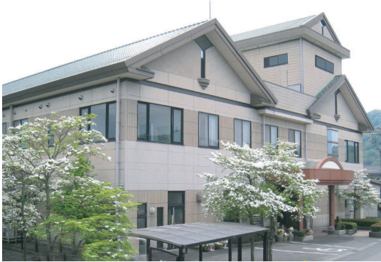
やまぐちハウス&山口クリニック